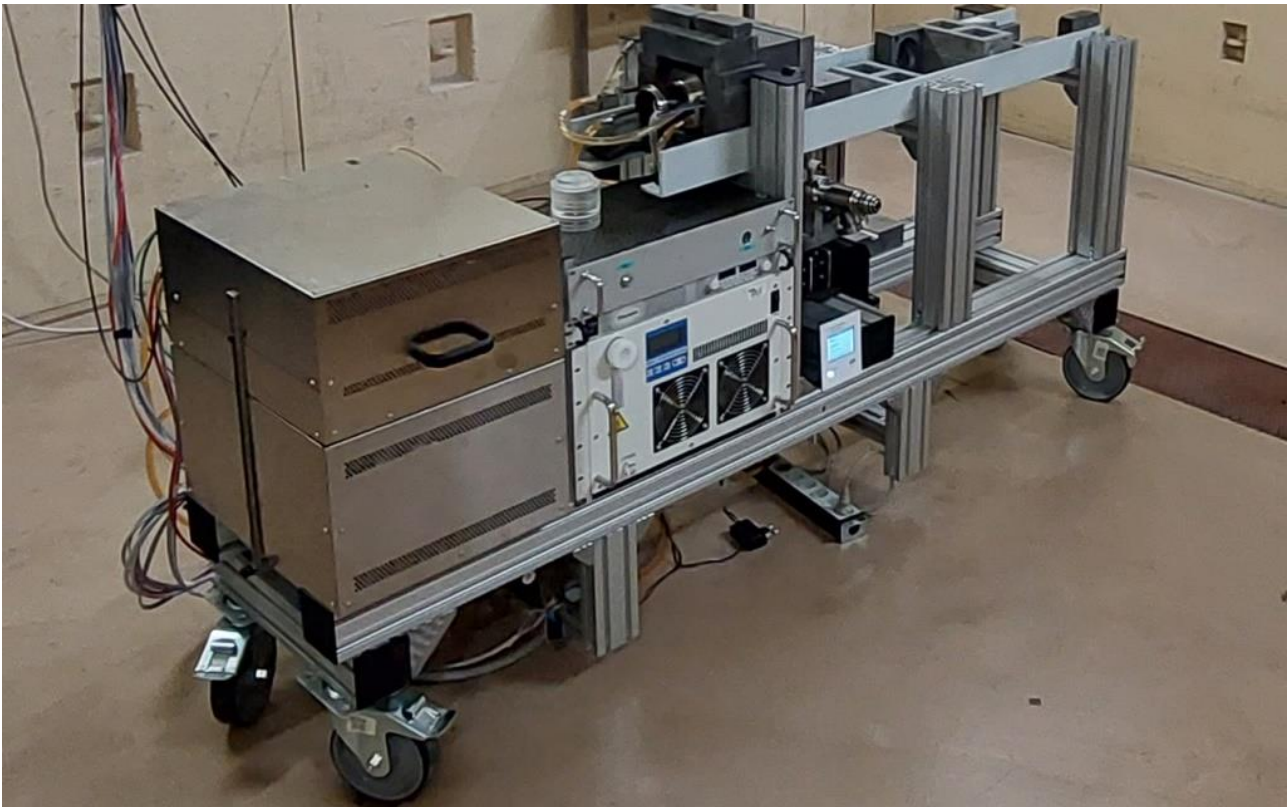
Figura.1. Foto del prototipo TECHEA-WP2 nello stato attuale.

La foto del prototipo è riportata in figura 1.